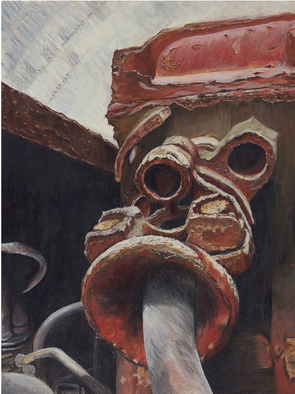
Martina Rosenberger, „Firstankerbohrwagen“, Eitempera auf Hartfaser, 40 x 30 cm